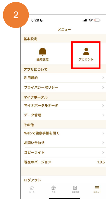
アカウントを選択